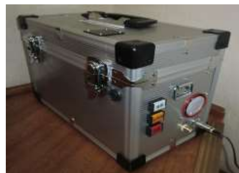
トランク型ケースに組み込んだ例

*3 設定(震度 1.5~4.4*)以上に揺れると、内蔵ブザーをプレアラームモードで鳴動させる機能です。