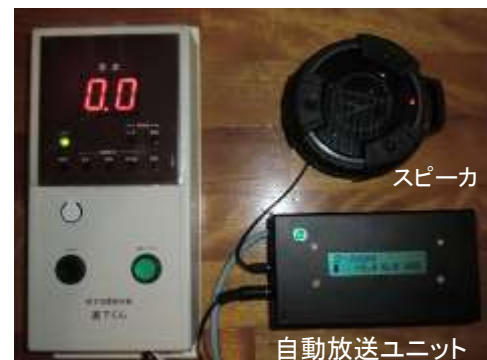
自動放送ユニットの接続例