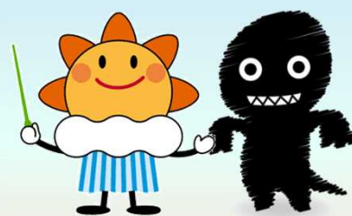
気象庁マスコットキャラクター「はれるん」 シェイクアウトキャラクター「ケイク」